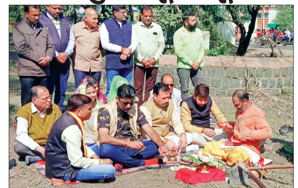
बागली। नगर परिषद ने निर्माण कार्य का किया भूमि-पूजन।